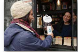
● 一般社団法人 Social Innovation Japan