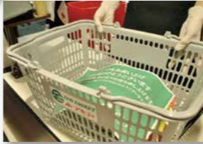
● 協同組合亀岡ショッピングセンター (アミティ)