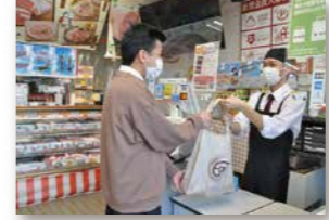
● 株式会社やまむらや