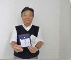
● 京都タクシー株式会社 新京都タクシー株式会社