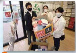
● 株式会社ユニクロ 亀岡店