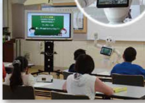
● ソフトバンク株式会社