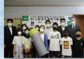
● BRITA Japan 株式会社