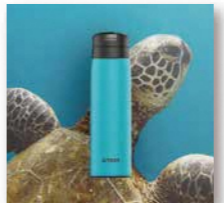
● タイガー魔法瓶株式会社