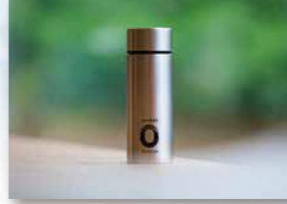
● 株式会社 DESIGN WORKS ANCIENT