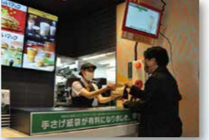
● 日本マクドナルド株式会社