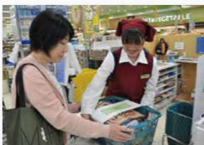
● 株式会社マツモト