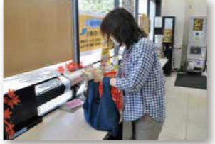
● 株式会社ハートフレンド (フレスコ)