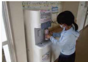
● ウォータースタンド 株式会社