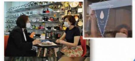
● 第一生命保険株式会社