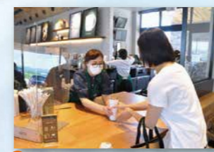
● スターバックス コーヒー ジャパン株式会社