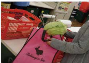
● 株式会社イオン リテール株式会社