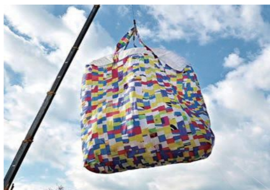
JR亀岡駅北口に掲げた巨大FLY BAG