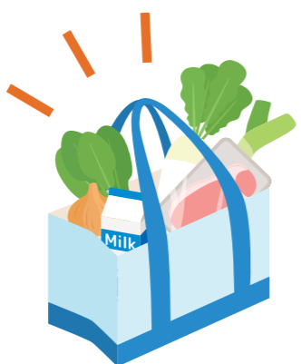
エコバッグで解決!

このことによりさらに、エコバッグが普及し、レジ袋の使用枚数が大きく減少することで全体的なコスト削減につながると考えています。