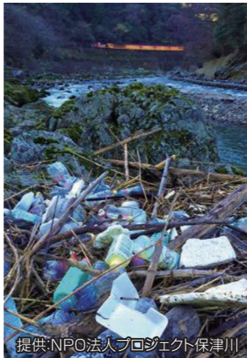
保津川の様子